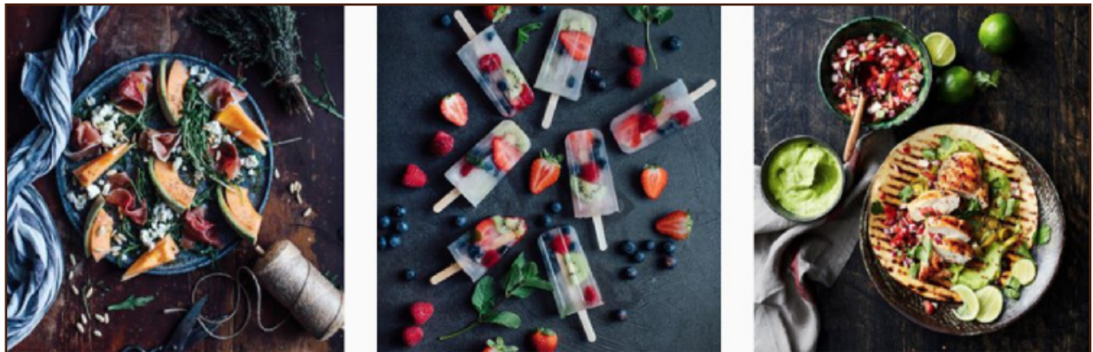
Abbildung 3: Ausschnitt des Instagram-Feeds von Edeka (Rother, 2018b, S. 68)

Gewichtung einzelner Kategorien in der Gesamtheit aller untersuchten Unternehmensbeiträge (Abb. 3), mit den im ersten Forschungsprojekt herausgestellten Tendenzen abgeglichen. 9